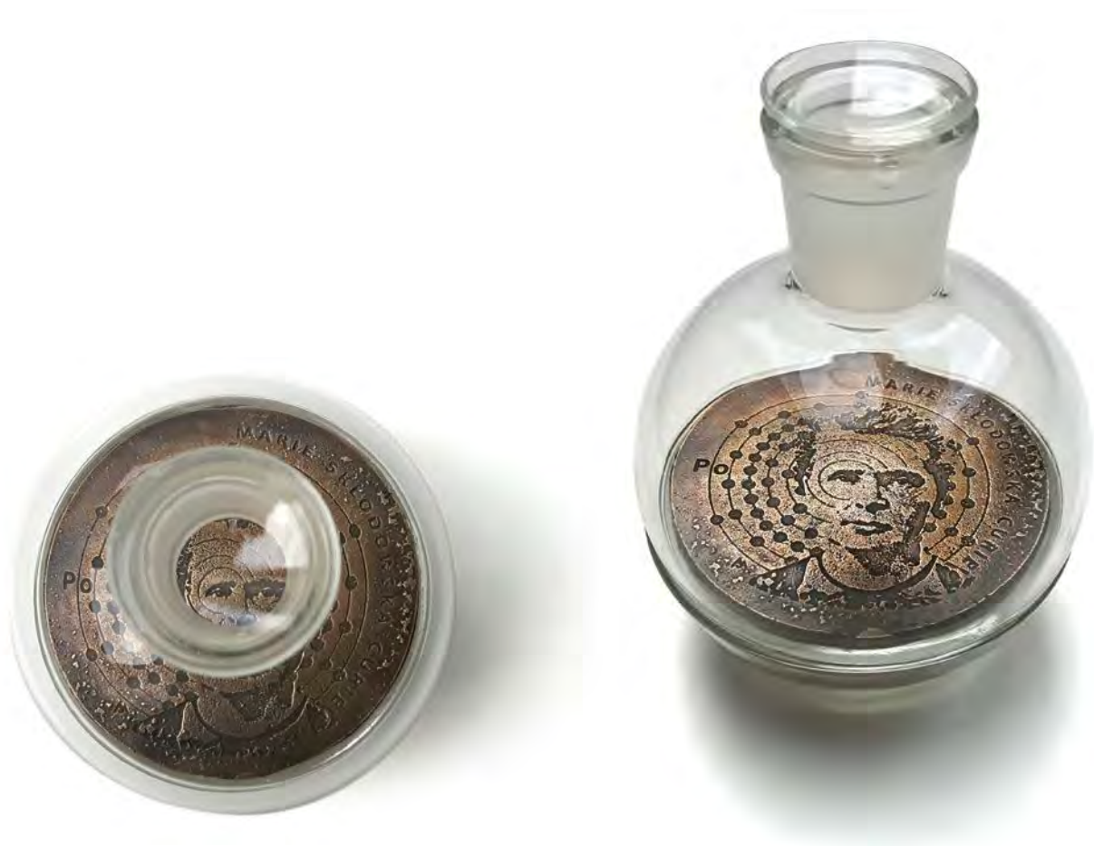
Marie Skłodowska Curie , 2017, lasi, pronssi 90 x 110 mm

laiseen, jota Marie Curie itsekin käytti. Lopputuloksena arvostava ja lämmin mutta jollakin tavoin pahaenteinen. Sen voi nähdä myös kuvana mitalitaiteen kasvukivuista. Vai voiko? Kun muotokuva ei ole tilaustyö elävästä ihmisestä, siinä uskaltaa vapaammin tavoitella kohtalokkaita sävyjä, mikä merkitsee irtiottoa etäistä kunnioitusta huokuvasta henkilömitalista. Lasiastian sulkeminen tarjoaa kätevästi uuden tulkintakehikon.