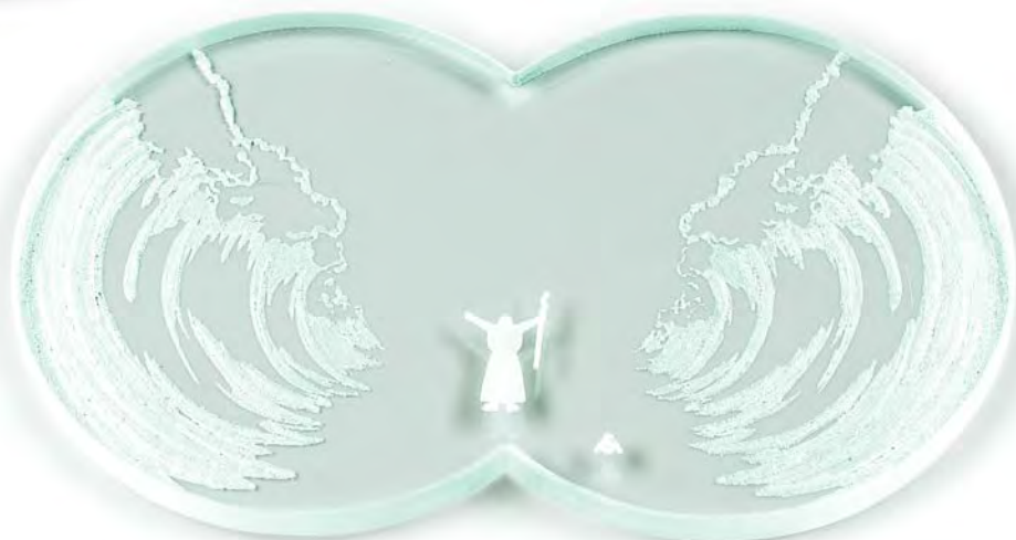
Crossing the Red Sea , 2022 lasi 160 mm

Lasista valmistetut työt asettavat sivudynamiikan toisessakin suhteessa suhteen uuteen valoon. Mikołajczak: ”Lasimateriaalin käyttö avaa aivan uusia mahdollisuuksia kehittämällä aihetta, joka siinä näyttää läpinäkyvyyden ansiosta ’penetroituvan’ mitalin reunojen väliin. Tämä kiehtoo minua suuresti.” 11 Aiheen tunkeutuminen itse mitalin sisään ikään kuin samanaikaistaa puolet samalla kun se on aiheen, idean sanelemaa. Läpinäkyvä materiaali soveltuu esimerkiksi veden kuvaamiseen mitalissa Crossing the Red Sea (2022), jossa Mooses on sananmukaisesti keskellä vesimassoja. Mitali on kuin diptyyppi, joka muodollaan tukee raamatullisen kertomuksen kaksijakoista mahtavuutta.