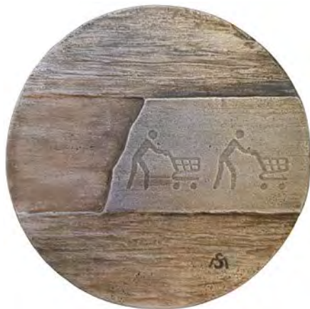
Hunt , 2017 alumiini 90 mm