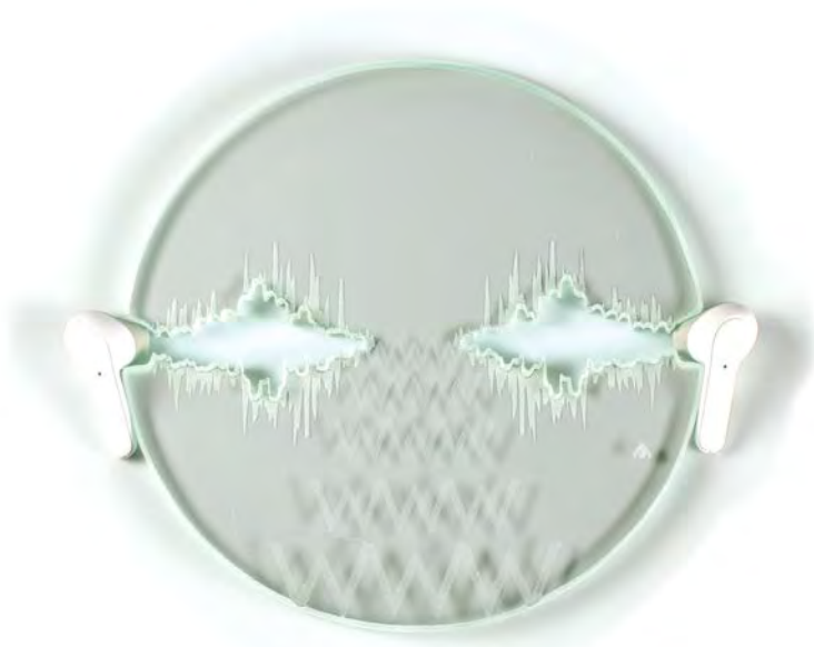
Odysseus' travels - the singing of sirens, 2022, lasi, kuulokkeet, mp3-nauhoitus 165 mm