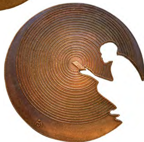
Illumination , 2018 pronssi 100 mm