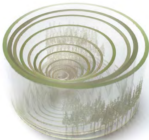
Landscape , 2009 lasi 80 mm

Näitä poikkeamia on paljonkin ja monen kohdalla sisältö jättää pohdinnan mitalin muodollisista rajoista helposti taka-alalle. Kiinnostava erityistapaus on Landscape (2005). Siinä on