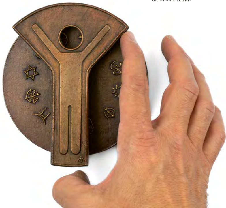
Faith, 2018, alumiini 110 mm