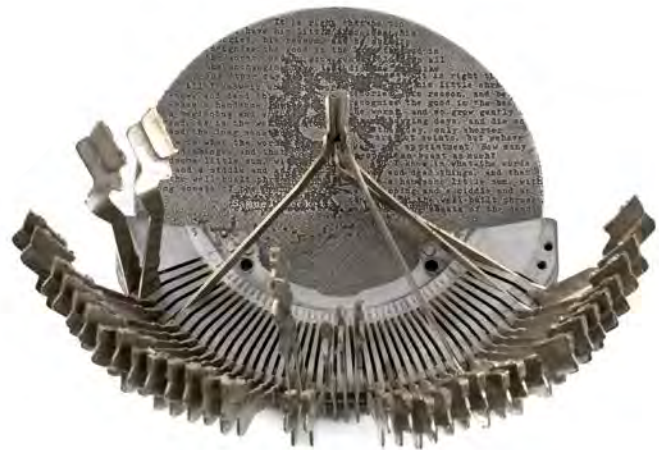
Samuel Beckett , 2012, alumiini, teräs 120 mm