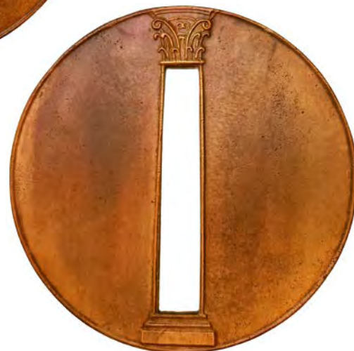
Pillar of the Epoch , 2018 pronssi 110 mm