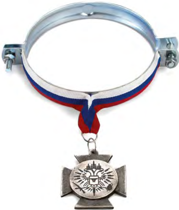
Medals of dis/honor , 2022, teräs, valumetalli, duralumiini 240 x 160 mm