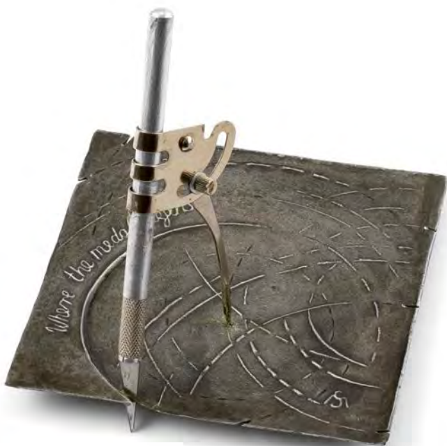
Where the Medal Begins? , 2014, alumiini 120 x 120 mm

tilaa. Taiteilijan päätös vaikuttaa oikealta: ympyrä – koska kyseessä on mitali, tasainen pinta – koska se on reliefi... Juuri niin... Juuri tässä teoksessa, sen keskikohdassa näyttäytyy täysulotteinen esine! Pystyy asetettu harppi rikkoo tarkoituksellisesti kaiken ennalta määritetyn järjestyksen: mitalin ei välttämättä tarvitse olla pieni, pyöreä metallipala eikä litteä reliefi. Itse teos on sekä kauniisti sommiteltu että toteutettu – yksityiskohdat on huomioitu selkeästi ja muodon rakenne noudattaa parhaita, klassisia sommitteluperiaatteita. Aivan... loistavaa dissonanssia!” 6