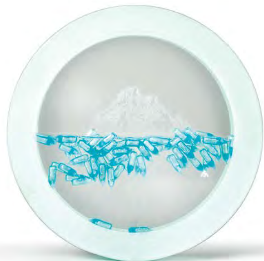
New Island , 2020 lasi, vesi, 3D-tulostetut pullo 120 mm

ja merten saastumista. Mitali on perinteisen pyöreä mutta toimii vähän samaan tapaan kuin pyrypallo tai maisemakupla, sillä sisällä on vettä. Siinä kelluu pikkuruusia 3D-tulostettuja pulloja, sananmukaista mikromuovia, joka on vaaraksi meriluonnolle ja ihmisille. Lasiin tehty kaiverrus kuvaa jäätiköiden sulamista. Epävakaas on käsin kosketeltavaa.