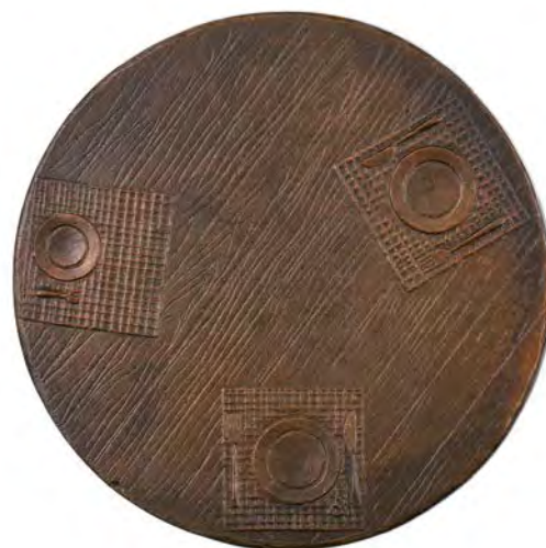
My Family, 2020, valettu pronssi 120 mm