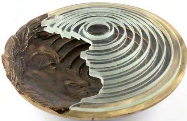
Divine Comedy – Hell, Purgatory, Heaven. 700th Anniversary of the death of Dante Alighieri, 2021. pronssi, lasi 150 x 80 mm