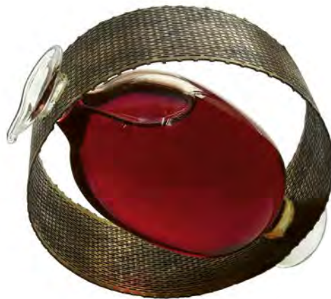
Bacchus, 2010, lasi, messinki, viini 100 mm