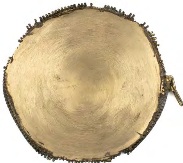
Dialogue , 2009, pronssi 100 mm

Mitaleiden ainutlaatuisuus, kopioiden pieni määrä ja signeeraaminen tuo mieleen originaaligrafikan käsitteen, joka syntyi 1800-luvun loppupuolella, kun taidegrafiikka alkoi eriytyä omaksi taiteenlajikseen. Tuolloin korostettiin grafiikan alkuperäisyyttä suhteessa painotuotteisiin, ja ammattivedostajien tuottaman grafiikan sijasta pidettiin tärkeänä vedosten persoonallista luonnetta, sitä että taiteilija on tehnyt ne itse. Vedosten määrä oli rajoitettu ja niiden välillä vaihtelunvaraa vedoksesta toiseen. 16 Hieman samansuuntaista kehitystä nähtiin mitalitaiteessa, kun pienennyskoneen myötä mitalitaiteilijan tehtävät siirtyivät rahapajojen kaivertajilta kuvanveistäjille ja uudelleen elpynyt valutekniikka edelleen vahvasti mitaleiden yksilöllisyyttä.