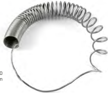
Time , 2010 teräs 150 mm