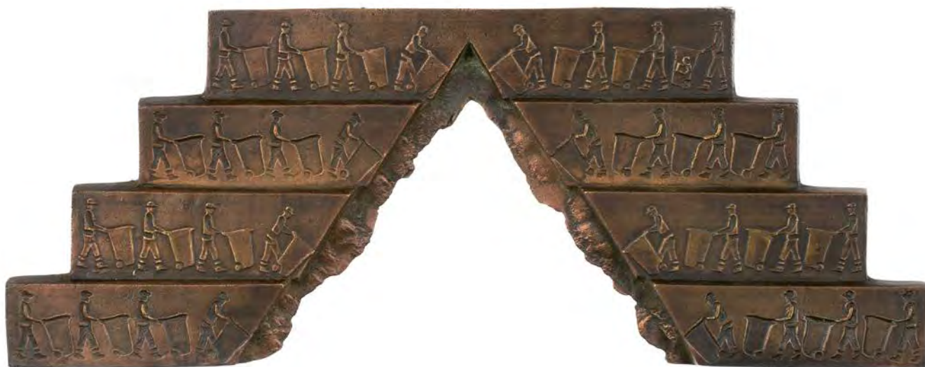
Civilization , 2016 alumiini 260 x 100 mm

Mikołajczakin työ kyllä ponnistaa perinteestä mutta etäännyy siis siitä tarvittaessa kauas. Useimmat mitaleista ovat vakiintuneeseen tapaan pyöreitä ja metalliin valettuja. Ensimmäinen on kuitenkin aina idea, jolle muoto, materiaalit ja tekotapa ovat alisteisia. Jos pyöreä formaatti ei toimi, Mikołajczak käyttää jotakin muuta, kuten mitalissa Civilization (2016), jonka sisältö rakentuu roska-astioiden jätteestä täyttyväksi näkymättömäksi vuoreksi. Vapaa muoto on nykymitalitaiteessa tavanomainen ominaisuus – joskaan ei aina kovin perusteltu, jos muoto sinänsä ei ole merkityksellinen. Civilizationin kokonaishahmo kuitenkin on jo viesti: tyhjän päälle rakentunut portaikko tekee näkyväksi ongelman, jota ei haluta nähdä. Yhteiskunnan hierarkiasta riippumatta kaikki kantavat kortensa samaan epätoivottavaan kekkoon. Vaikka mitali hahmoltaan erkaantuu totutusta, se ei ole veistos sinänsä, vaan myös alusta, jolla kertova sisältö on graafisesti ilmaistu.