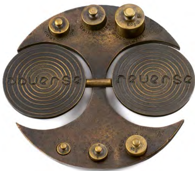
Recipe for a Medal , 2015 pronssi 130 mm