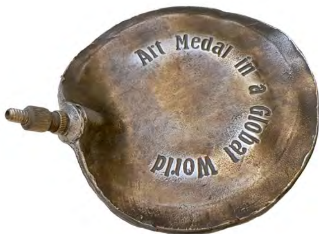
Art Medal in a Global World, 2010, alumiini, 120 mm

tio mitaleiden arvostuksesta, siitä miten mitalit ovat nyky-yhteiskunnassa menettäneet alkuperäisen tehtävänsä. 3 Puhuiko mitali siinä tapauksessa itsestään myös urheilumaailman (jalkapallon) uhrina? Mitaleillahan tarkoitetaan nykyisin ensi sijassa urheilupalkintoja. Ehkä alumiinimateriaali havainnollisti sekä esikuvansa keveyttä että kohteensa painoarvoa. Puhe jatkuu, kerrokset kuoriutuvat.